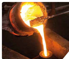
Briques pour les fours industriels (réfractaire), meules et équipements de polissage (abrasif)

Fort de son savoir-faire en tant qu'acteur industriel historique du monde des alumines, Alteo vise les plus hauts niveaux de qualité produit et de service client.