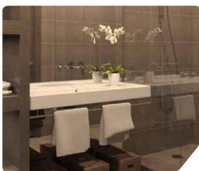
Carrelage, sanitaire, porcelaine (céramique classique)