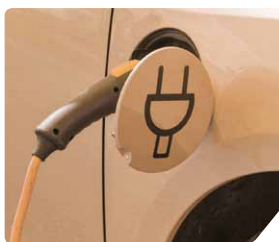
Filtre à particule, bougie, batterie lithium-ion des véhicules électriques (céramique technique), résine et revêtement anti-feu (ignifugation)