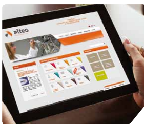
Verre LCD des TV, smartphones et tablettes, flaconnage de luxe, panneau solaire (verre spécial)

Ces produits de haute technicité sont proposés sous près de 400 références pour les marchés des céramiques, réfractaires, abrasifs, verres spéciaux, ignifugation et industrie chimique. Ils sont livrés à plus de 650 clients répartis sur 1 000 sites dans le monde.