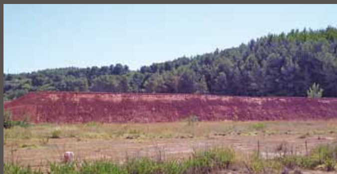
Réalisation d'une digue en Bauxaline® sur le site de Mange-Garri (mai 2006)

Une digue d'essai est réalisée en 2006 sur le site Alteo de Mange-Garri (Bouc-Bel-Air).